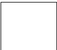
ሀረግ-ብዙ አይተነው ሲኒየር አፕሬሽን ኦፊሰር ምስራቅ አዲስ ዲስትሪክት እ.ኤ.አ ጥቅምት 11 ቀን 2021