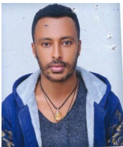
እንዳለ ሙሉ ሲሲቲቪ ካሜራ አፕሬትር ዋ/መ/ቤት እ.ኤ.አ ታህሳስ 1 ቀን 2021