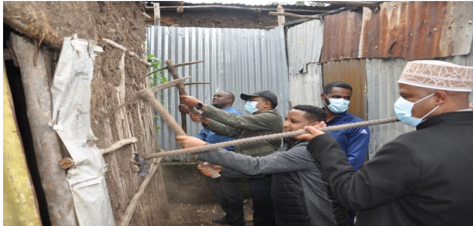
የቤት እድሳት አጀማመር በከፊል